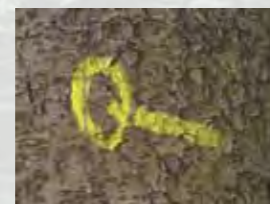
Na poti boste naleteli na nenavadne "markacije". Gre za oznako poti po mejah občine Trzin, predstavlja pa znamenito "trzinsko sekirico".

Izdala in založila: Občina Trzin Besedilo: Zdenka Oblak, Miro Štebe Trasa poti: Janez Mušič Avtorica maskote: Jana Urbas Zemljevid in skica: Krešimir Keresteš, MapDesign d.o.o. Oblikovanje: Emil Pevec Tisk: Tiskarna Ravnikar, Domžale Naklada: 3000 izvodov Trzin, 2012