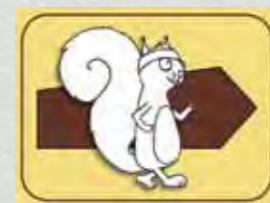
Pot po Gozdni učni poti Onger nam kaže prikupna ververica.

obutev in tudi pohodne palice. Nevarnejši odsek je na mestu, kjer se pot približa robu trzinskega kamnoloma. Tam je sicer dobro razgledišče zdaj zaščiteno z varnostno ograjo, vendar vsem obiskovalcem svetujemo previdnost in da naj se ne približujejo robu prepada.