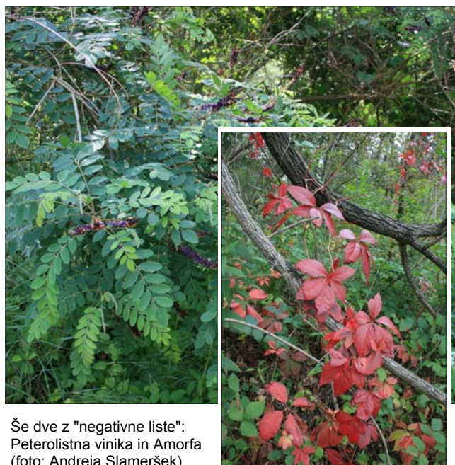
Še dve z "negativne liste": Peterolistna vinika in Amorfa